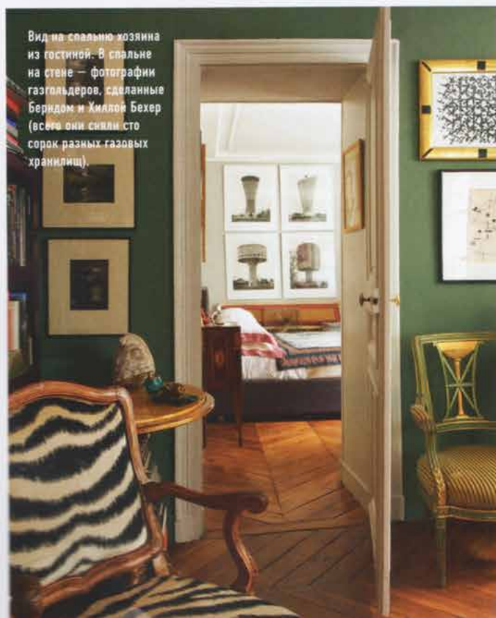
Вид на спальню хозяина из гостиной. В спальне на стене – фотографии газгольдеров, сделанные Беридом и Хиллой Бехер (все это они сняли сто сорок разных газовых хранилищ).