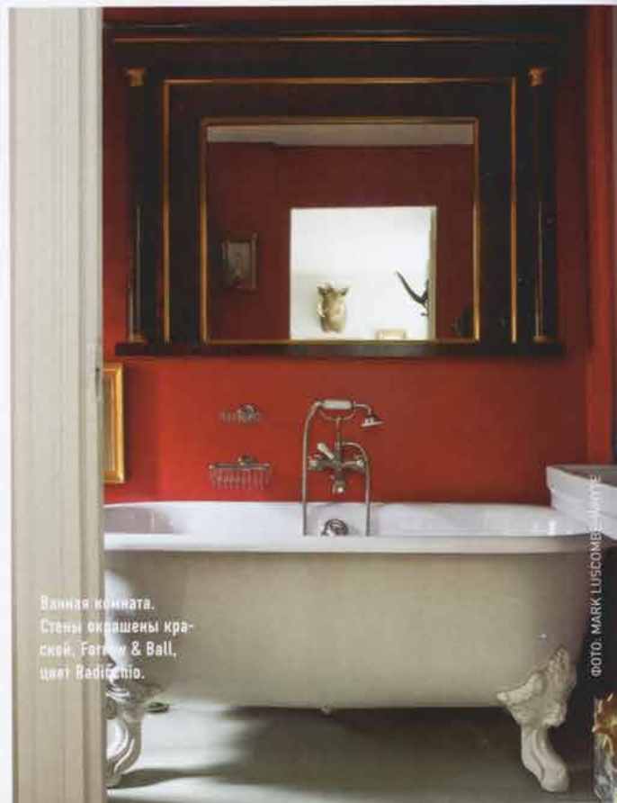
Ванная комната. Стены окрашены краской, Farrow & Ball, цвет Radcliffe.