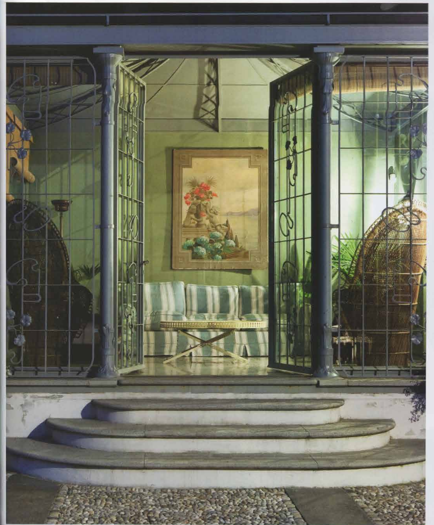
Fiori e stoffe. Il giardino d'inverno è stato aggiunto al corpo principale di cui riprende motivi e decori. Le colonne di ghisa sono un recupero dalla demolizione di un'altra parte della casa. Papier peint dell'800, poltrone marocchine. Pavimento in seminato veneziano. Pagina accanto, dall'alto: la terrazza verso il giardino. Shiko, uno dei levrieri della proprietaria. La finestra nella stanza da bagno è realizzata da un disegno di Piero Portaluppi, che era bisnonno di Castellini Baldissera.